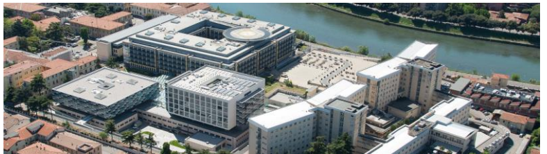
Borgo Trento Hospital