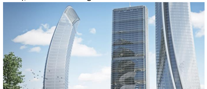
Libeskind og Hadid Towers