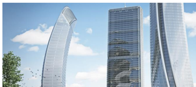
Libeskind og Hadid Towers