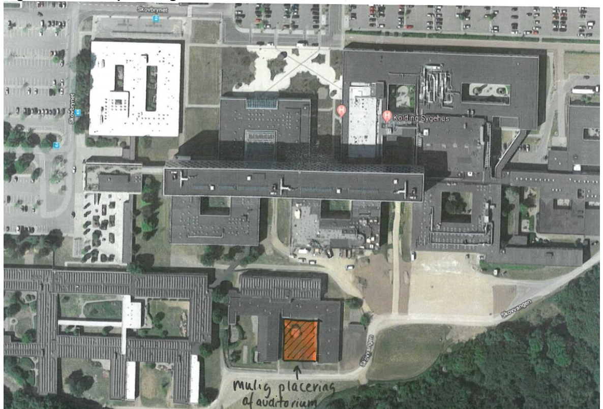
Figur 1: Skitse til placering af auditorium ved blok 14, ud mod skoven

En placering mellem eksisterende længer i blok 14 vil betyde, at auditoriet etableres i et område, hvor terrænniveauet omkring bygningen er i forskudte niveauer, således at adgang fra vestsiden sker i plan 1, mens adgang til terræn i østsiden er skrående. Ved at placere auditoriet på østsiden af blok 14, vil det ligge i nærhed til naturskønne omgivelser ved Marielundsskoven i Kolding.