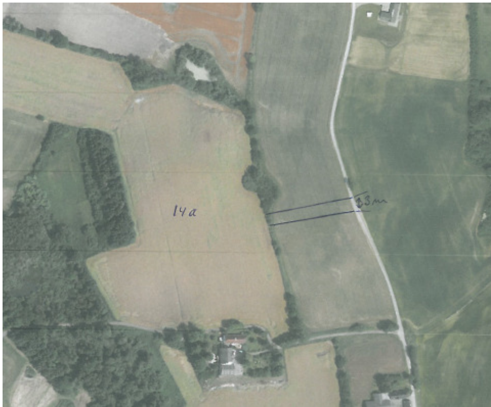
Figur 2. Ønsket placering af digegennembrud. © Cowi A/S