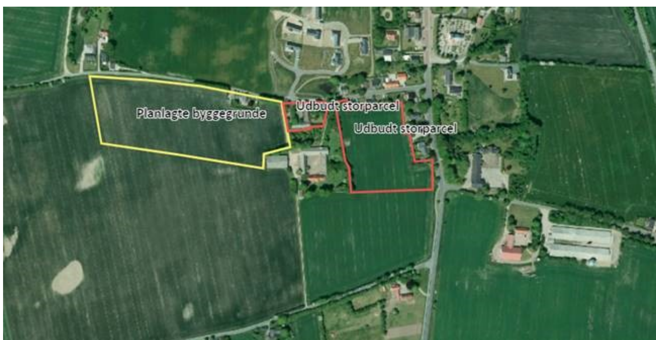
Figur 3.2. Luftfotoet viser Viuf by samt de planlagte byggegrunde syd for Vestersig (gult område) og den udbudte storparcel (rødt område) fra Kolding Kommune, 17. august 2022).

Kolding Kommune har gennemført planlægning for et nyt boligområde, syd for Viuf by på ca. 5 ha til boligformål. Se nedenstående kort: