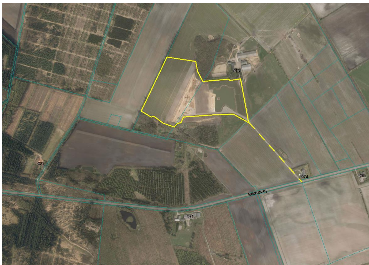
Oversigtskort. Gul streg omkranser graveområdet. Stiplet gul linje viser tilkørselsvejen til landevejen.