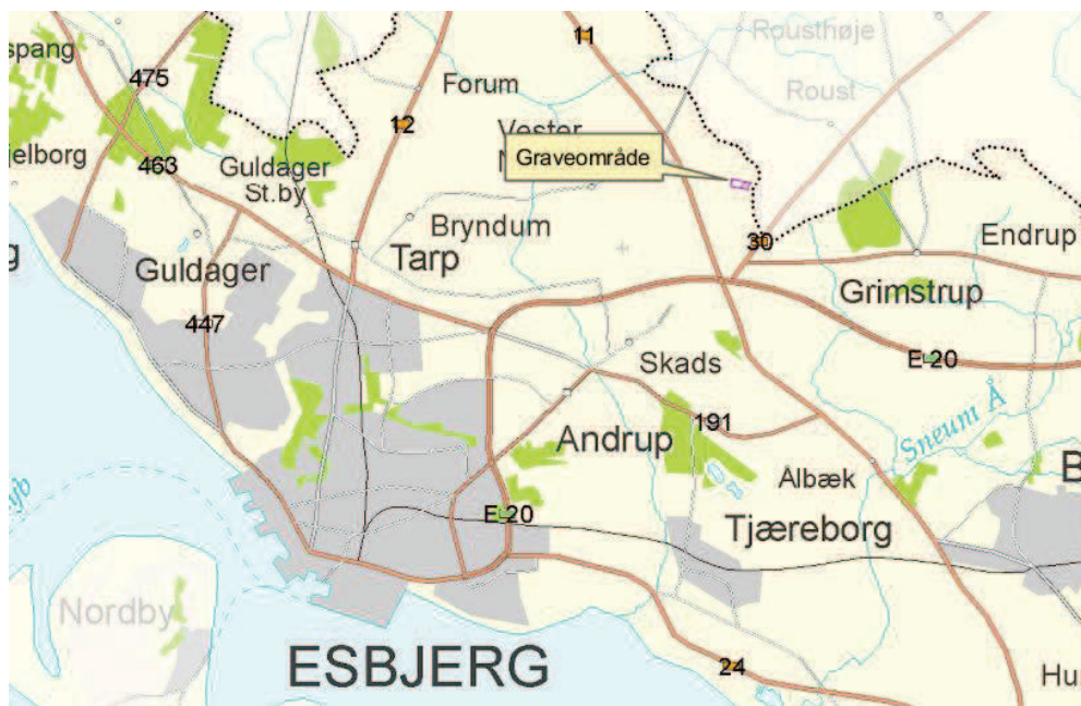
Oversigtskort - ikke målfast

Denne tilladelse vedrører alene tilladelse til grundvandssænkning. Afgørelse vedrørende fornyet gravetilladelse, VVM m.m. er meddelt separat.